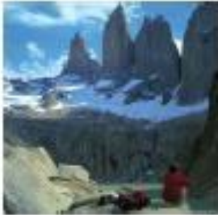
Torres del Paine

Recorta las siguientes imágenes y clasifícalas según formen parte del patrimonio natural o del patrimonio cultural de Chile.