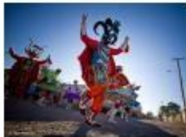
Fiesta de la Tirana