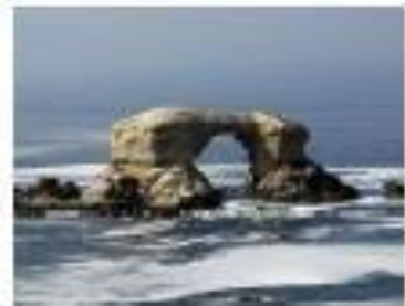
Portada de Antofagasta

Ahora, busca y recorta otras imágenes de nuestro patrimonio natural y cultural y pégalas clasificándolas.