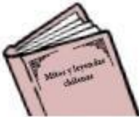
Mitos y leyendas chilenas