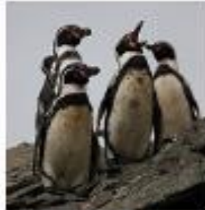
Pingüinos de Humboldt